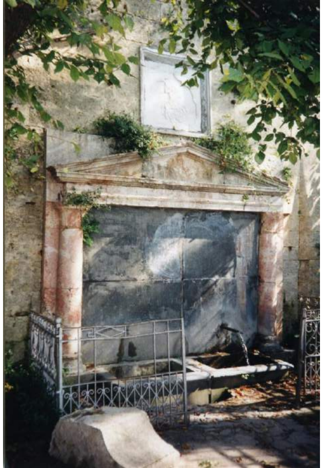
Памятник А.С. Пушкину на территории воинской части близ монастыря (слева). Источник Святого Георгия Победоносца в Свято-Георгиевском монастыре (справа)