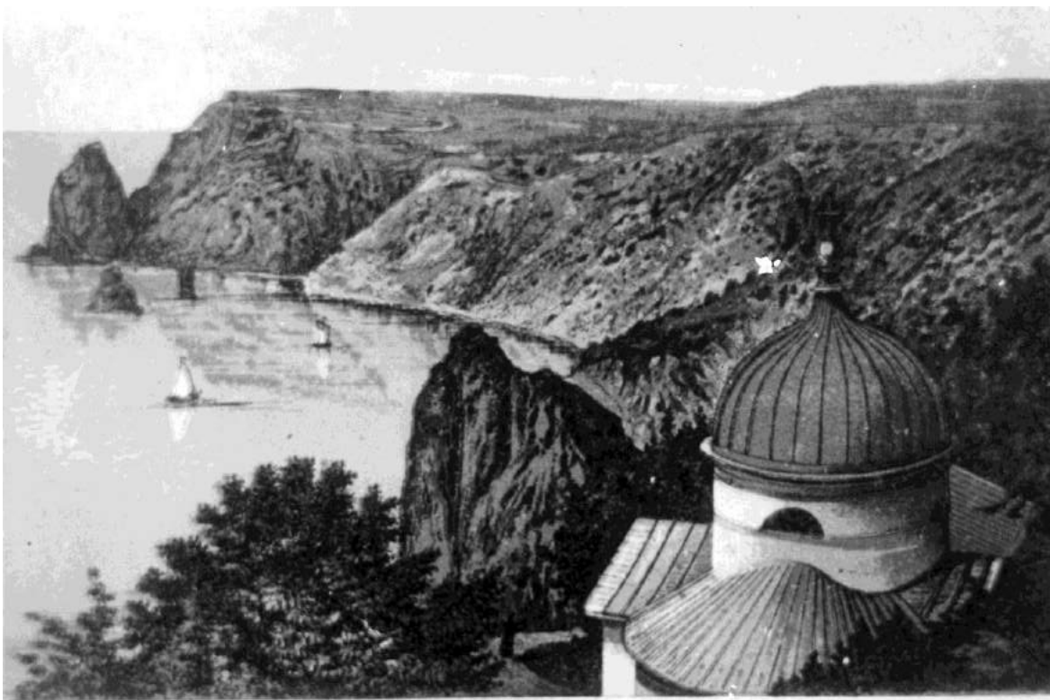
БУХТА ПРИ ГЕОРГІЕВСКОМЪ МОНАСТЫРЬ.