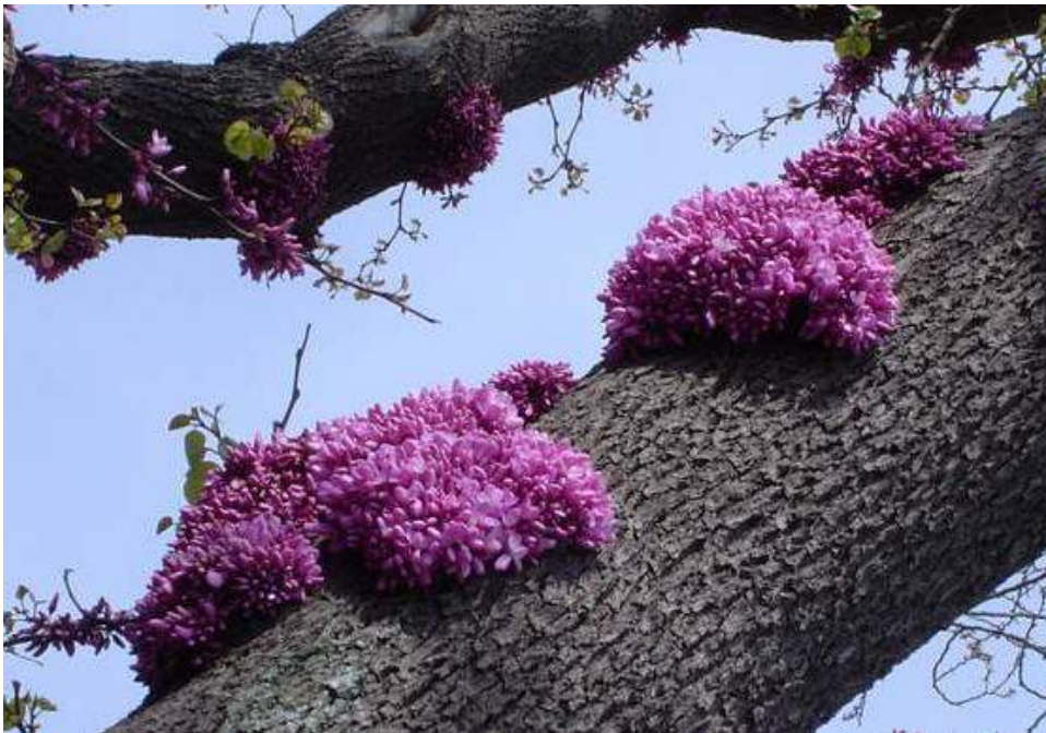
Цветение багряника на Фиоленте