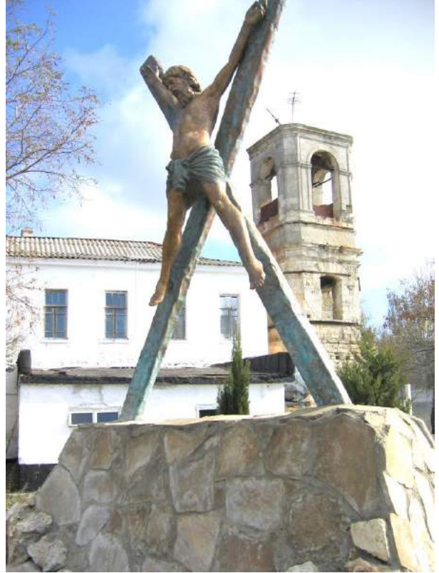
Фиолентовская бухта Скала Святого явления (слева), Памятник Андрею Первозванному на территории монастыря (2014 г.) (справа)