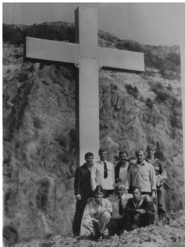
Транспортировка креста на скалу Святого явления 14 сентября 1991 г. (слева), Группа моряков установивших крест (справа)