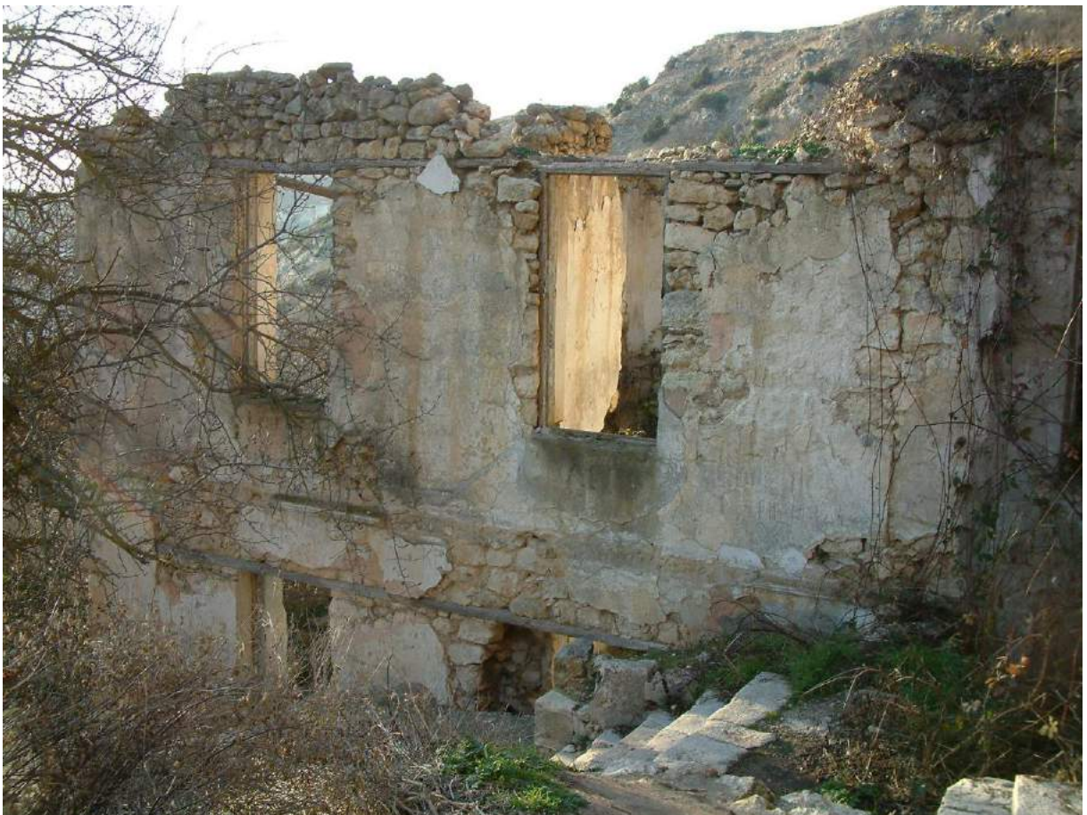
Развалины дома адмирала Лазарева (2006 г.)