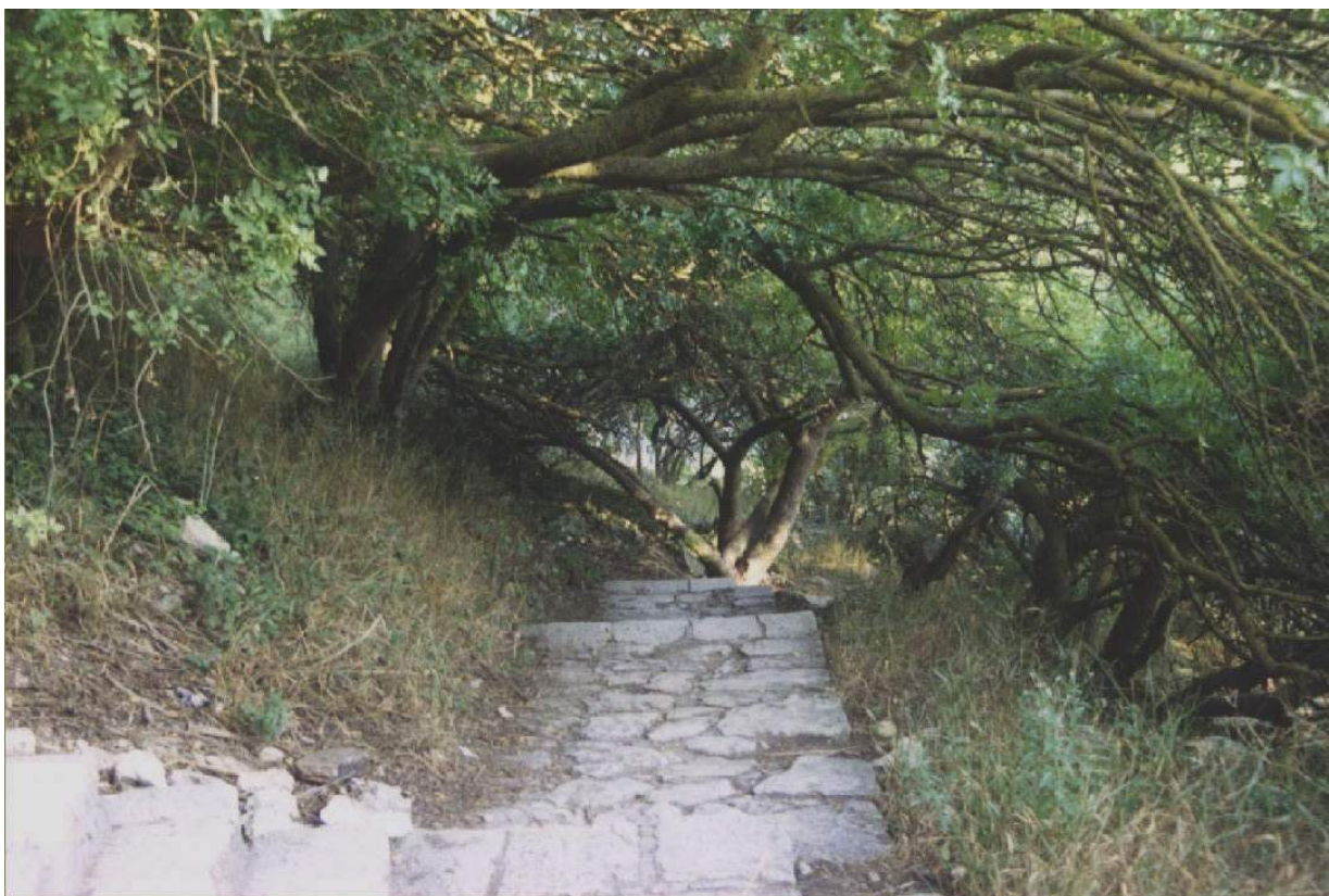
Лестница к пляжу «Яшмовый»