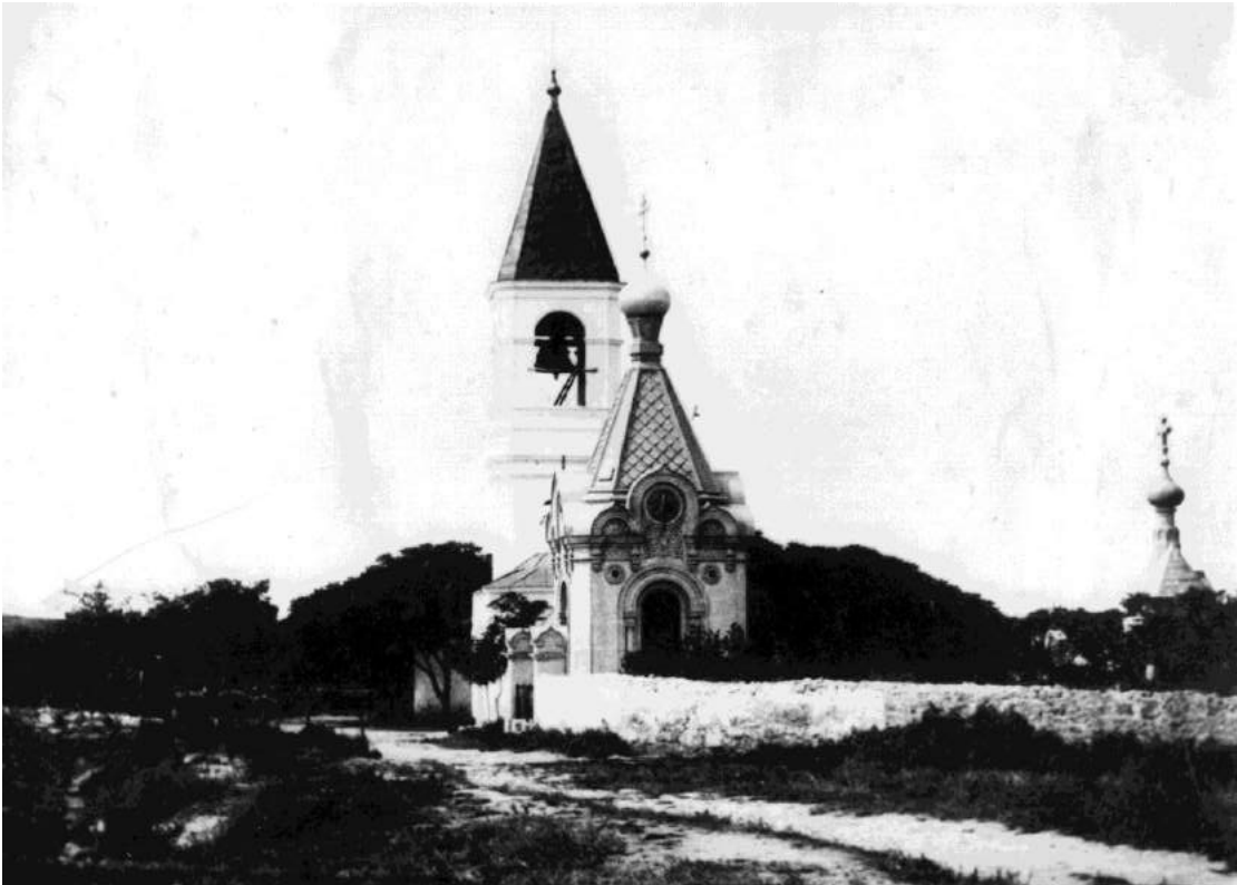
Колокольня и Часовня настоятеля Свято-Георгиевского монастыря Хрисанфа (1893г.)