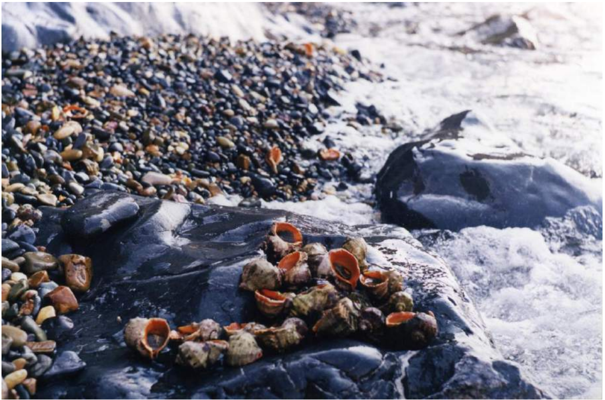
Рапаны на берегу